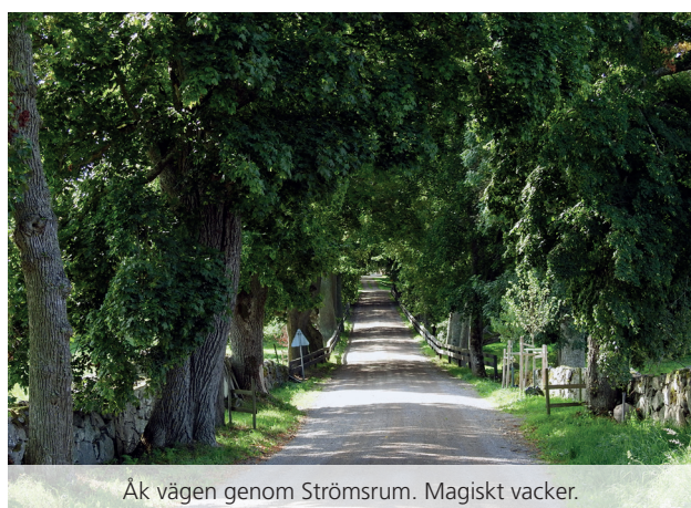
Åk vägen genom Strömsrum. Magiskt vacker.