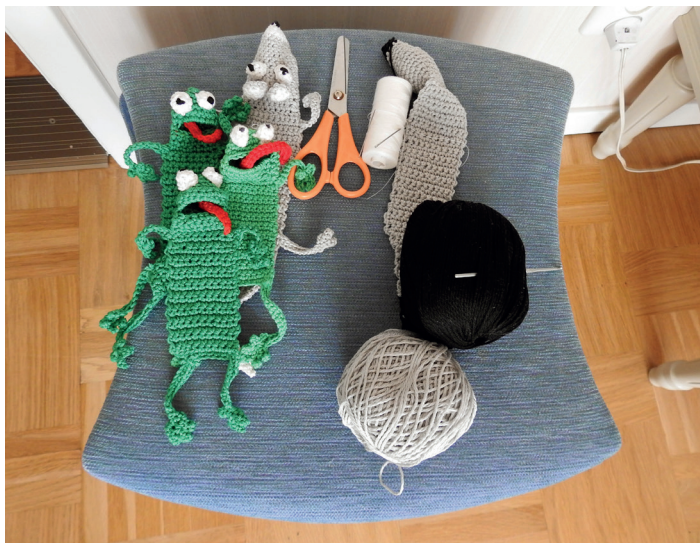
Virkade små gulliga bokmärken, både grodor och råttor. Virkning är en av Ullas hobbyer.