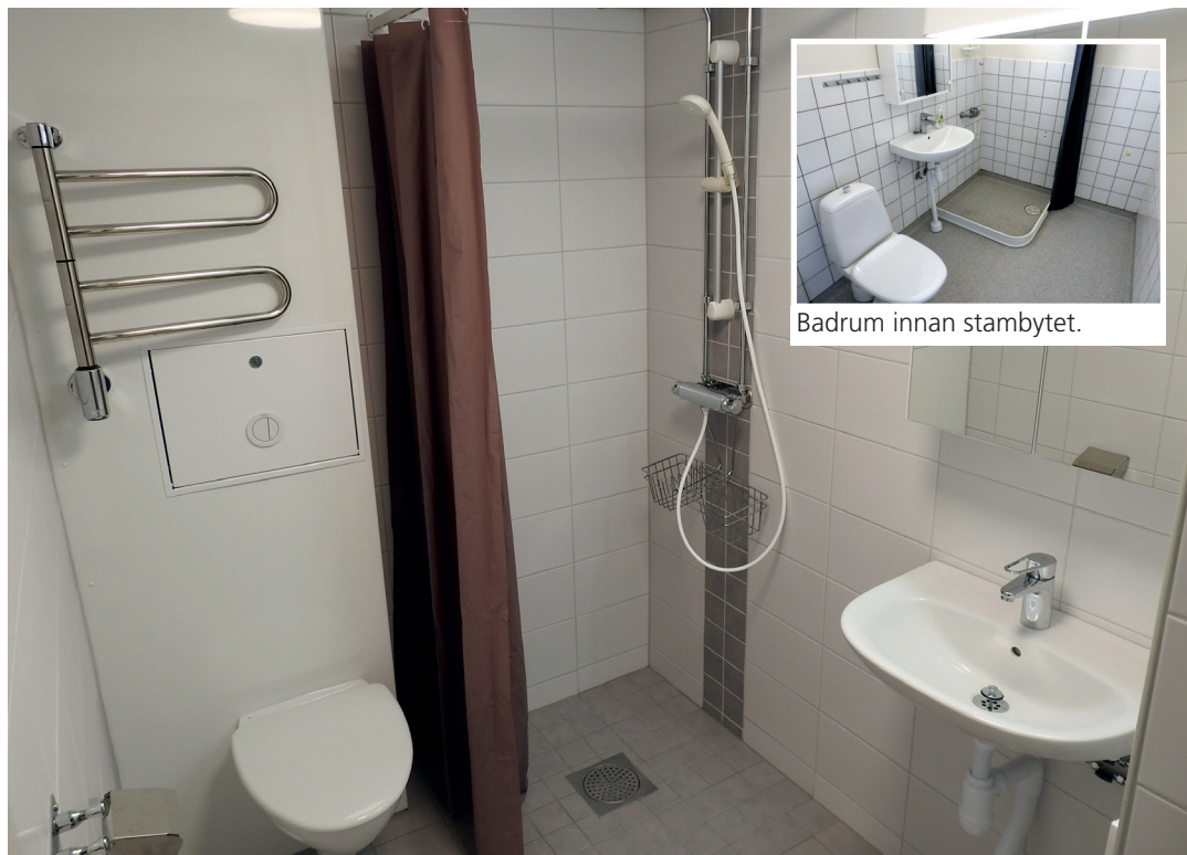
Badrum innan stambytet.

Så här snyggt blir det i badrummen efter stambytet.